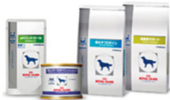
ワンちゃん用 食事療法食