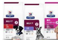
ワンちゃん用 食事療法食