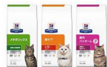
ネコちゃん用 食事療法食